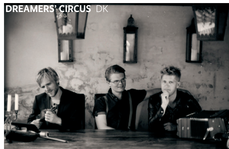
DREAMERS' CIRCUS DK

auf eine Bandbreite an eher unkonventionellen Instrumenten wie Claviola und Melodica zurück. Der Spaß allerdings, den ihr das alles bereitet, darf nicht darüber hinwegtäuschen, dass hier eine seriöse Künstlerin gerade rasch in die erste Liga der internationalen AkkordeonspielerInnen aufsteigt.