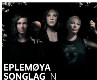
EPELMØYA SONGLAG N

forsalg 195 DKK (nedsat 110 DKK), i døren 210 DKK (nedsat 110 DKK)