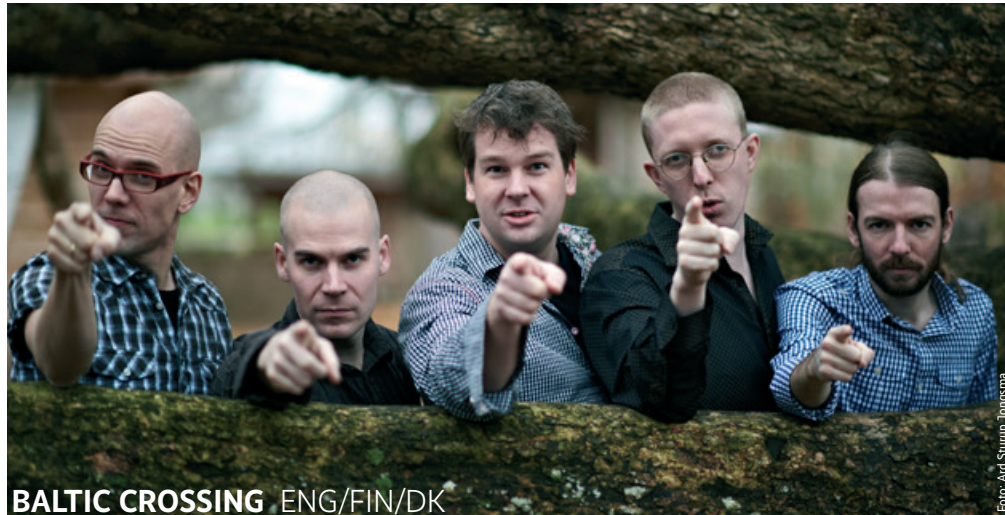
BALTIC CROSSING ENG/FIN/DK