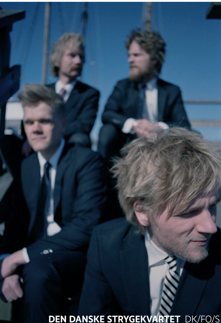
DEN DANSKE STRYGEKVARTET DK/FO/S

ensemble bei einem Folk-Festival auftritt? Das Quartett hat im vergangenen Jahr das Album „Wood Works“ veröffentlicht, auf dem auch Arrangements der traditionellen nordischen Folkmusik zu hören sind. Und das passt doch exzellent zu folkBALTICA!