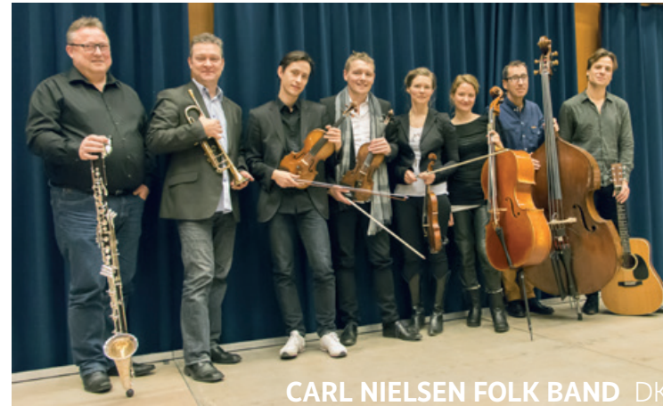
CARL NIELSEN FOLK BAND DK