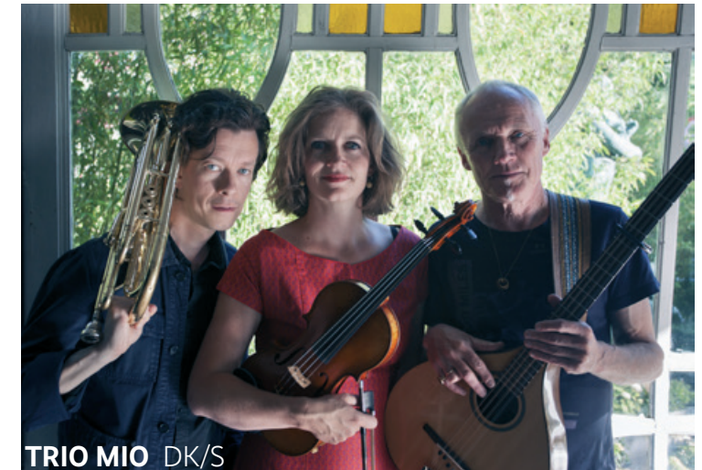
TRIO MIO DK/S

Kalüün und Trio Mio , fredag, 8. maj, kl. 20 St. Jürgen Kirche, Kirchstraße 1, D-24214 Gettorf