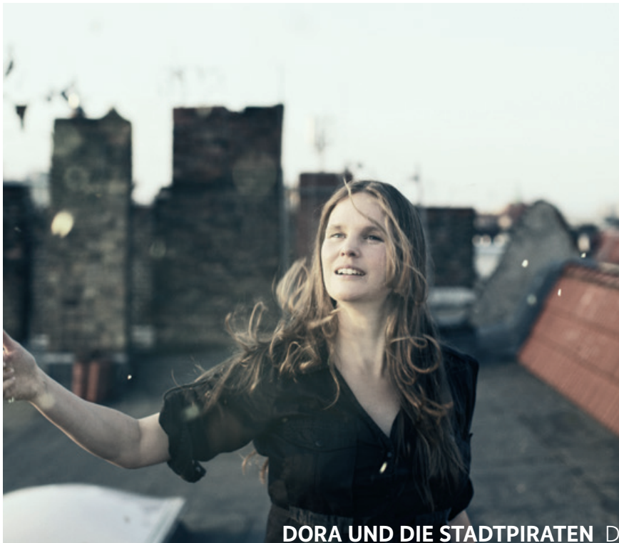
DORA UND DIE STADTPIRATEN D

Vi byder velkommen til en aften med eftertænksomme ballader, stærke ord, medrivende hooklines og to store sangerinder fra hver sin side af Østersøen.